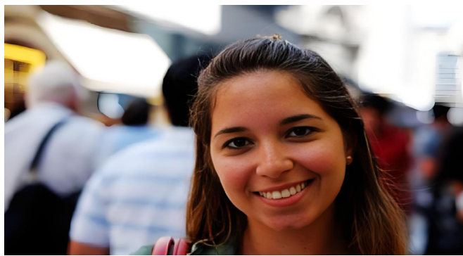
一名阿根廷女孩在布市五月广场对着镜头微笑。