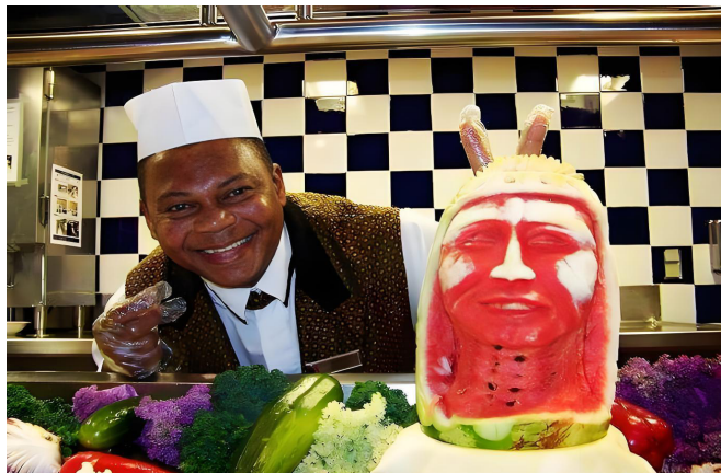
一名男子在巴哈马与他的水果雕塑合影。