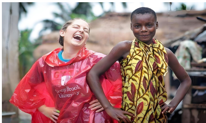
一个年轻女孩在加纳的 Ekumfi Obidan 学习 “The Macarena”。