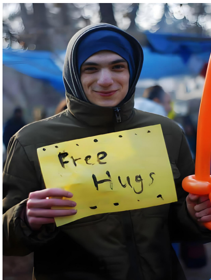
格鲁吉亚第比利斯，一名年轻人提供免费拥抱。