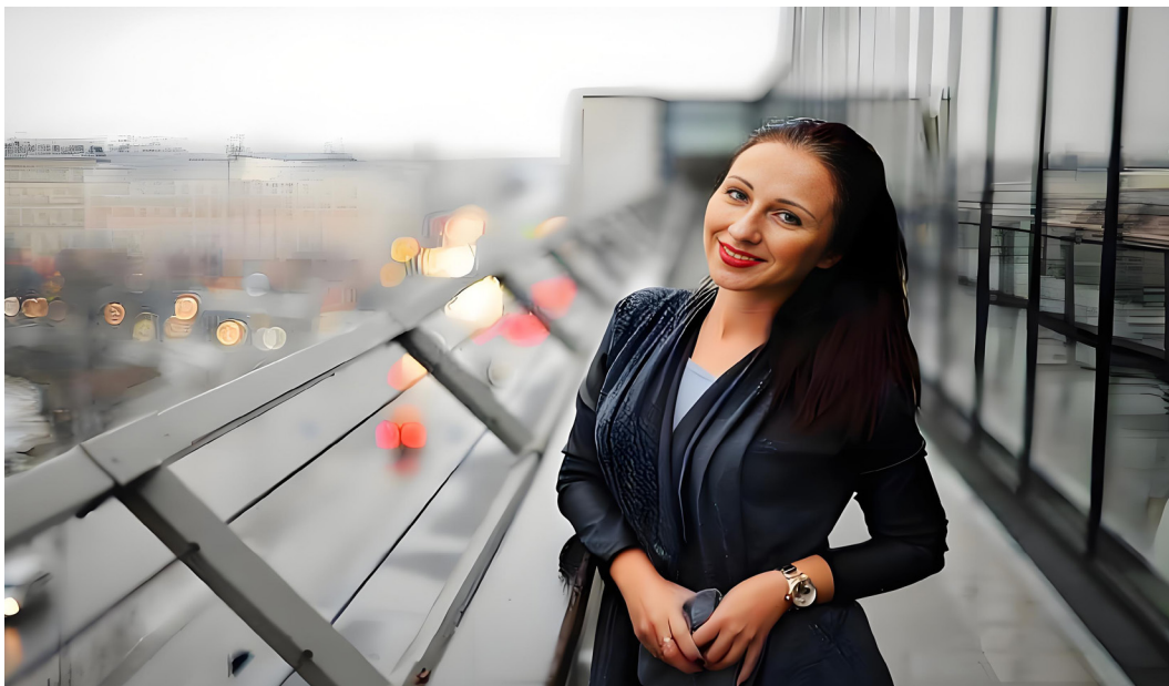
年轻漂亮的女人在里加的一座桥上微笑。