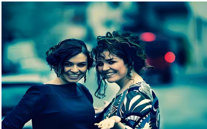
两名年轻女性在波斯尼亚街头拍照留念。