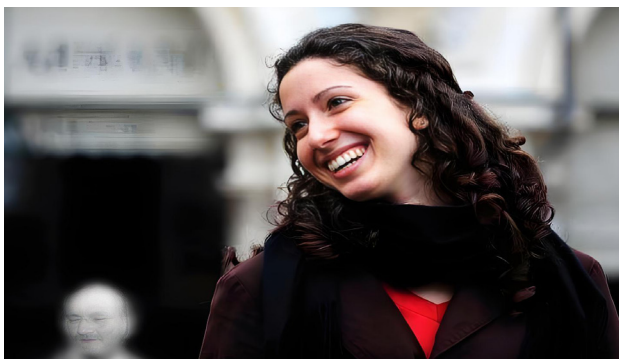
意大利都灵，一个美丽的女孩。