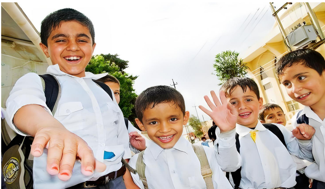
伊拉克库尔德学校课后的孩子们。