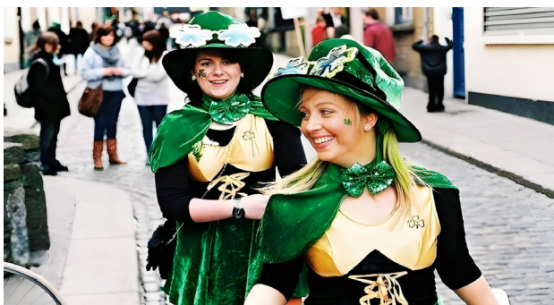
都柏林圣帕特里克节上的女人。