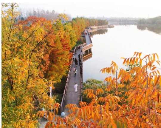
曲桥连岸环杉漾碧