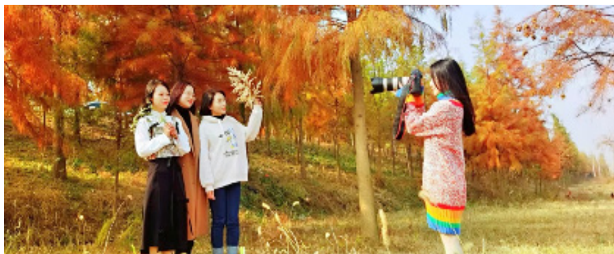
红林曳彩笑入晴柔