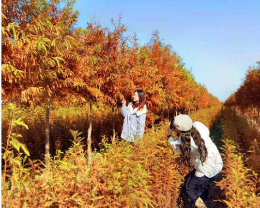
疏林染绛客迷景色

淮滨，这座位于河南省信阳市东部的小城，因“县城居淮河之滨”而得名。它地处豫皖两省交界处，淮河干流横贯县境中部，独特的地理位置和自然环境，赋予了淮滨丰富的地方特色和诱人的美食文化。