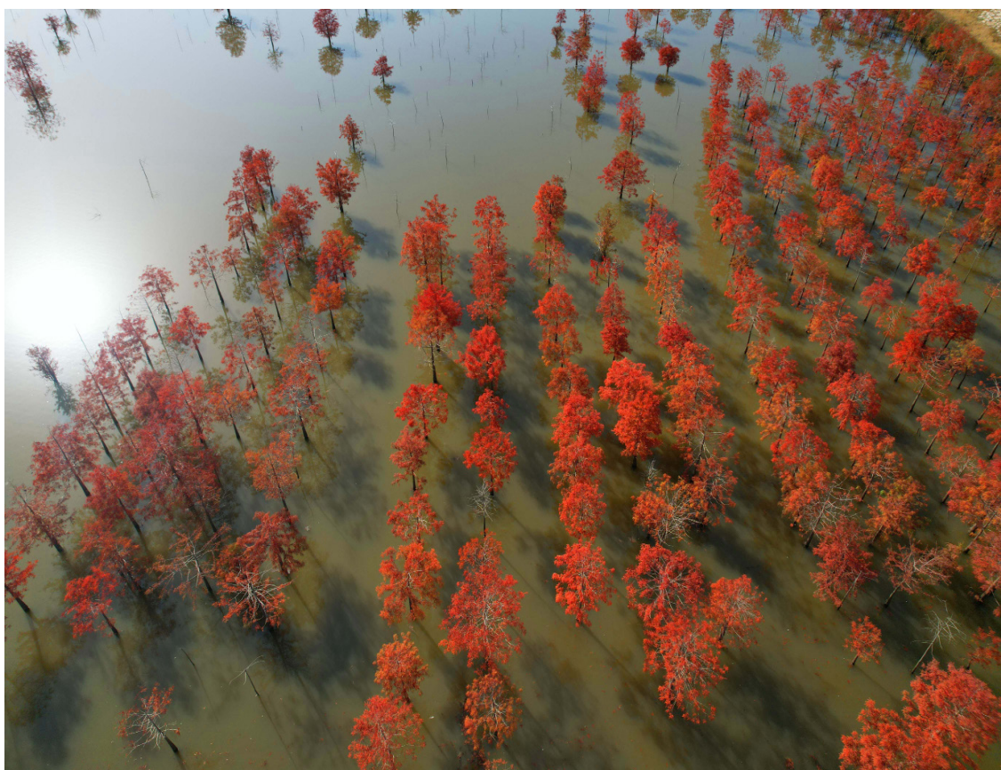
千杉浮泽生态呈祥