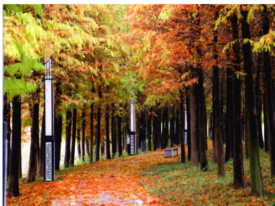
金枝铺径拥翠藏幽