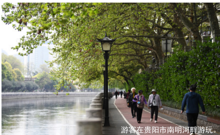
游客在贵阳市南明河畔游玩。