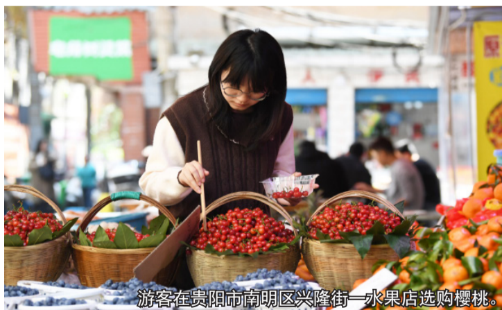
游客在贵阳市南明区兴隆街一水果店选购樱桃。