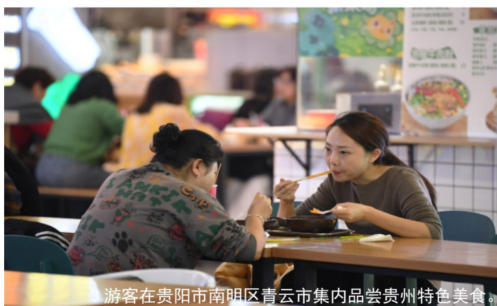
游客在贵阳市南明区青云市集内品尝贵州特色美食。