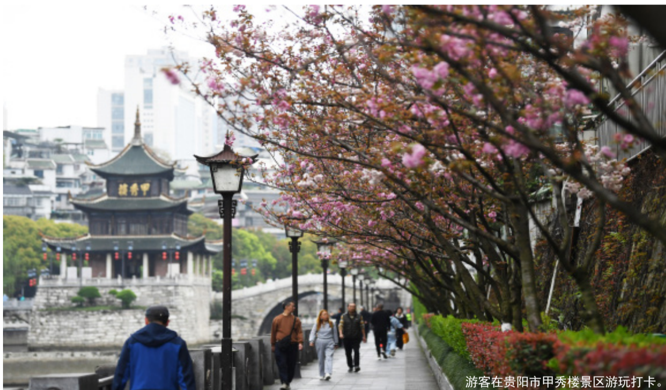
游客在贵阳市甲秀楼景区游玩打卡。