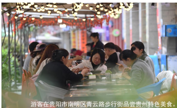
游客在贵阳市南明区青云路步行街品尝贵州特色美食。