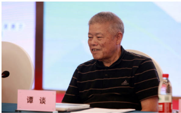
谭谈宣布第七届谢璞儿童文学奖启动。